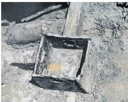
▲発掘された木樋（木で作られた水道管）

管の腐朽や利用者の減少などにより水質が悪化し、「コレラ」などの水系感染症の流行で多くの死者が出ました。そのような中で、「市民を病気から守り、都市として発展していくためには近代水道の創設が必要である。」との考えが芽生えたのです。