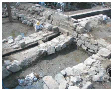
▲発掘された新井戸跡