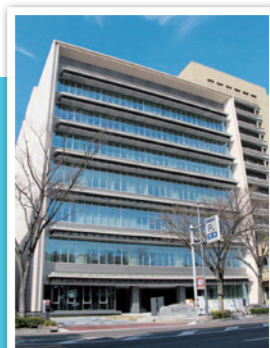
本部・高松ブロック統括センターがある高松市防災合同庁舎