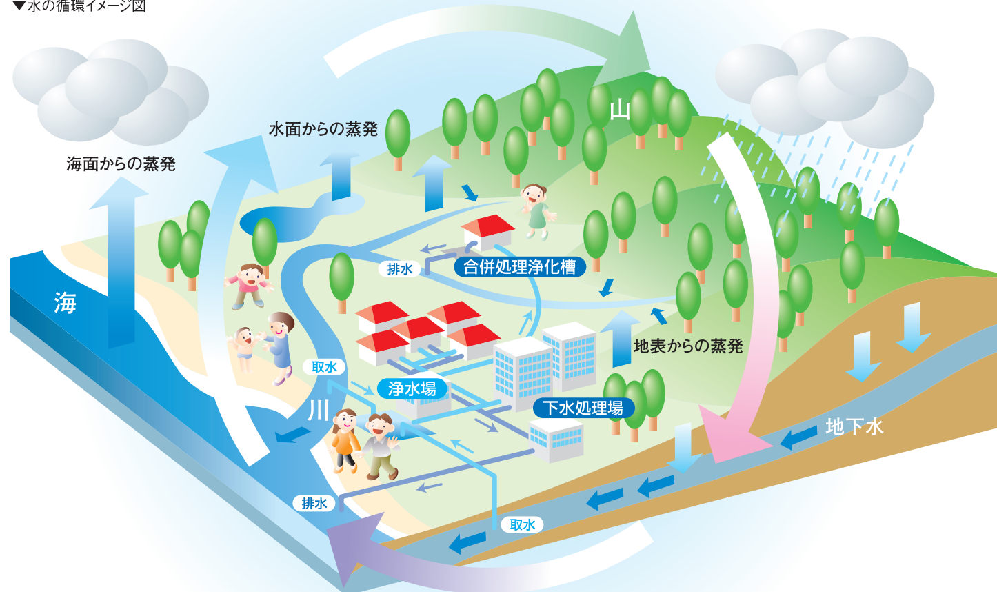
▼水の循環イメージ図