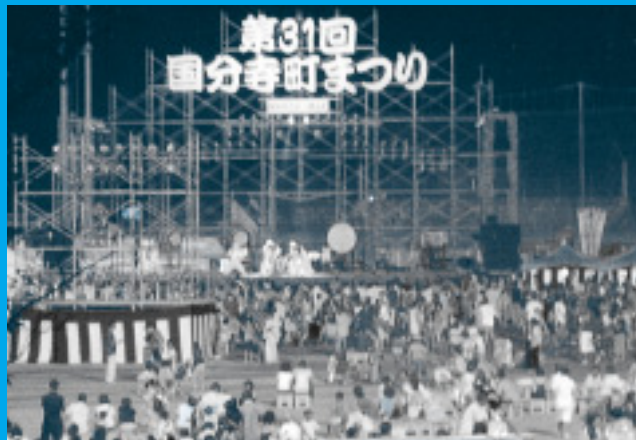
8月26、27日橋ノ丘総合運動公園で行われた国分寺町まつり

「白鳥」が描かれたとても ユニークな施設は、高台に 位置し、遠くから見ても人 目を引きまます。