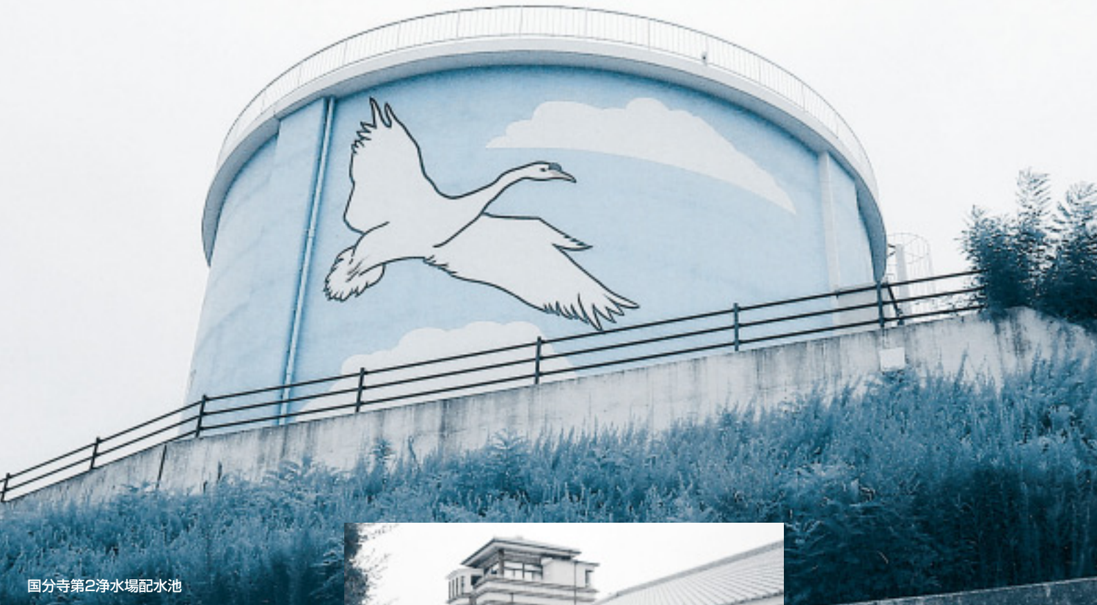
国分寺第2浄水場配水池