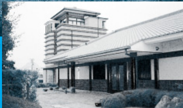
讃岐国分寺跡資料館