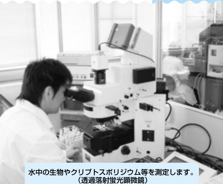
水中の生物やクリプトสปロジウム等を測定します。 (透過落射蛍光顕微鏡)