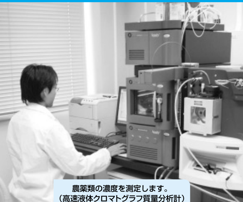
農薬類の濃度を測定します。 (高速液体クロマトグラフ質量分析計)