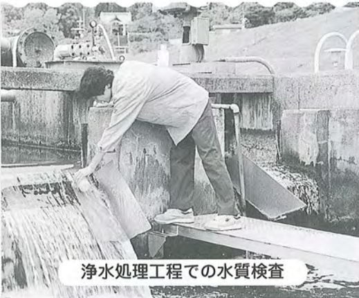
浄水処理工程での水質検査