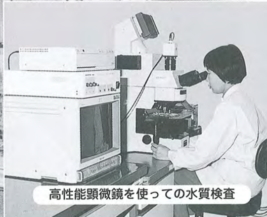
高性能顕微鏡を使つての水質検査