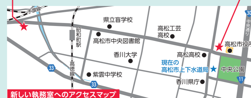
新しい執務室へのアクセスマップ