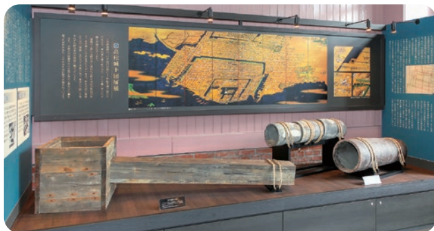
江戸時代に使われていた水道管