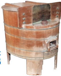
一般家庭で使われていた五右衛門風呂

当たり前のように使っている水道は先人たちの努力によって築かれたものであると感じられる場所です。ぜひご来館ください。