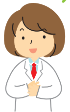
水の研究をしているまつこ助手